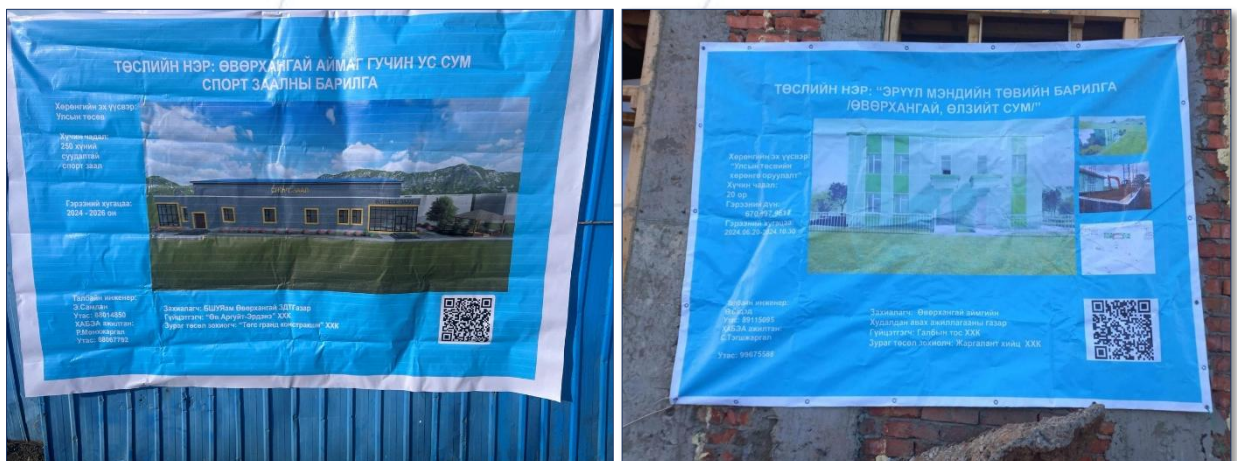
Зураг 5. Шаардлага хангаагүй мэдээллийн самбарын зураг