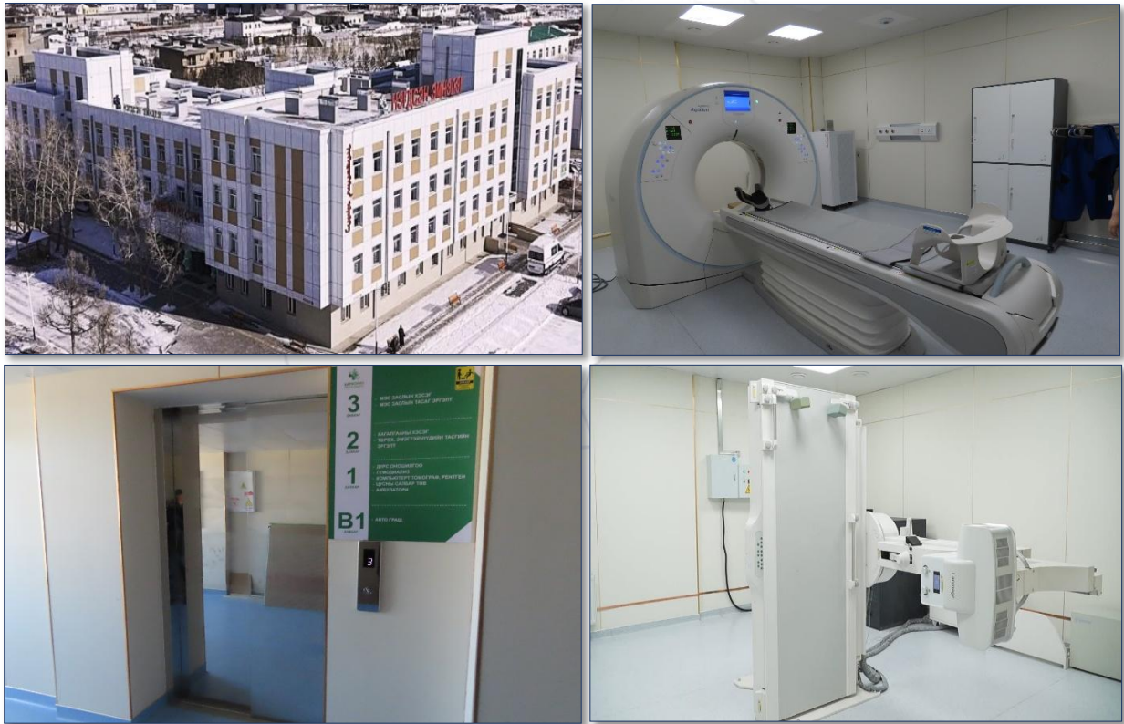
Зураг 3. Нэгдсэн эмнэлгийн барилга, 100 ор /Өвөрхангай, Хархорин сум/

Тус барилга ашиглалтад орсноор үйлчлүүлэгчид, эмч, эмнэлгийн ажилтнуудад аюулгүй, тав тухтай орчин бүрдэж, эрүүл мэндийн тусламж үйлчилгээний чанар, хүртээмж сайжирсан байна. Мөн иргэд орон нутагтаа чанартай оношилгоо, эмчилгээ хийлгэх боломж нэмэгдэж, дээд шатлалын эмнэлэгт хандах ачаалал буурах нөхцөл бүрджээ.