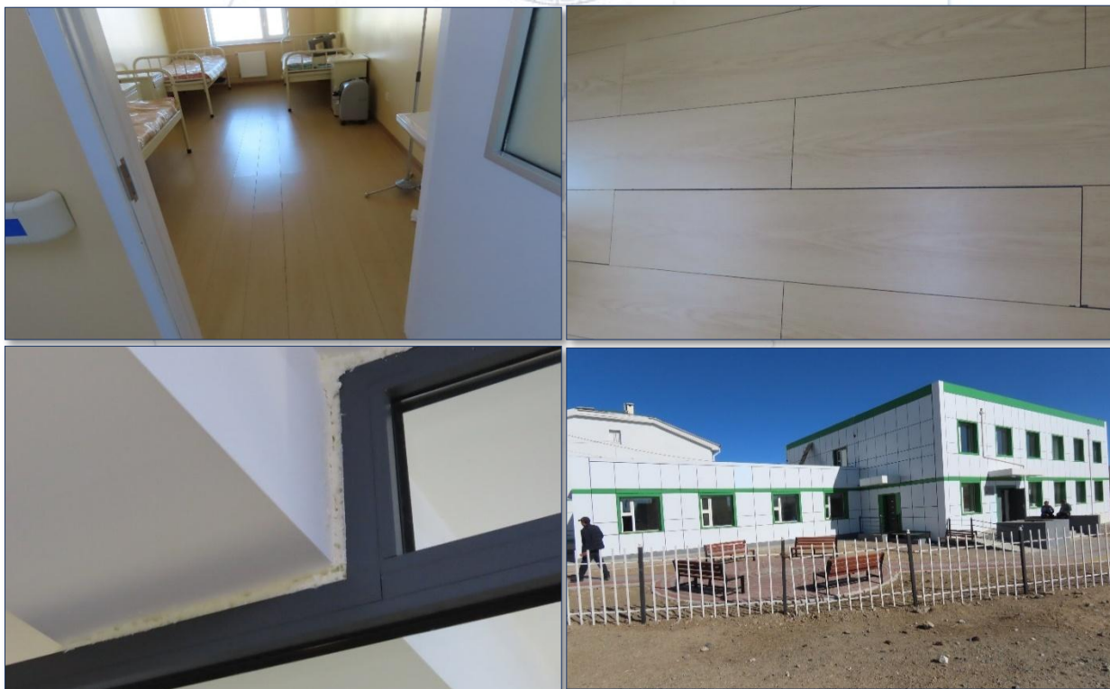
Зураг 1. Эрүүл мэндийн төвийн барилга /Өвөрхангай, Хужирт сум/