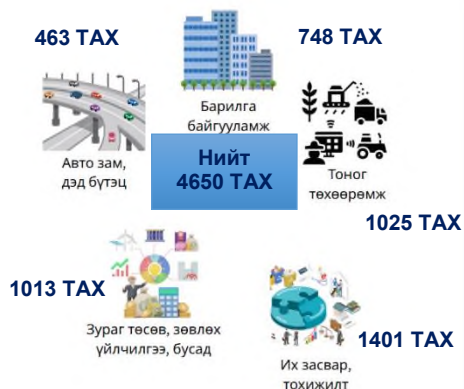
Дүрслэл 3 ТАХ-ний ангилал

3.3. Ажлын даалгавар, техникийн тодорхойлолтгүй, магадлалын дүгнэлтгүй, худалдан авах ажиллагаанд оролцогчгүй, төсвийн тодотголоор санхүүжилт хасагдсан зэрэг шалтгаанаар зарим ТАХ хэрэгжээгүй байна.