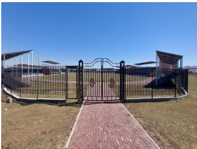
/Ерөө сумын Наадмын талбайн тохижилт/

3.1.2 Өмнөх оноос шилжин хэрэгжих 55, шинээр эхлэх 109 зэрэг нийт 164 төсөл, арга хэмжээ (авто зам, дэд бүтцийн 16, барилга байгууламжийн 8, их засвар, тохижилтын 57, тоног төхөөрөмж 60, зураг төсөв, зөвлөх үйлчилгээ болон бусад 23) -г тайлант онд хэрэгжүүлж дуусгахаар нийт 23,480.7 сая төгрөгийн гэрээ байгуулсан байна. (Дэлгэрэнгүйг Судалгаа 3-т харуулав.)