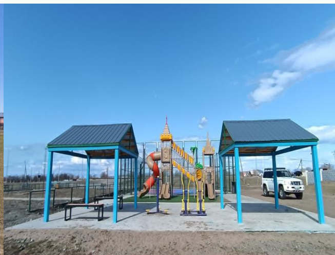
/Сүхбаатар сумын Хүүхдийн тоглоомын талбай байгуулах/

3.1.3 Тайлант онд дуусгахаар гэрээ байгуулсан 164 төсөл, арга хэмжээнээс нийт 14,792.0 сая төгрөгийн гэрээний үнийн дүнтэй 148 төсөл, арга хэмжээ нь бүрэн хэрэгжиж комиссын актаар ашиглалтад хүлээн авсан байна.