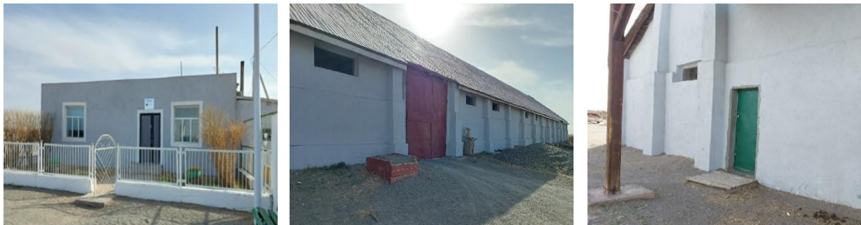
Зураг №04 Улсын нөөцийн 114 дүгээр салбарын байр, агуулахын барилгын засварын дараах зураг

- Гурвантэс сумын төсвийн 1,155.6 сая төгрөгөөр хэрэгжүүлсэн дунд сургуулийн барилгын их засварын зураг төсөл зургийн даалгавраас зөрүүтэй хийгдсэн байхад захиалагч хүлээн авч 2025 оны хөрөнгө оруулалтын төсөл арга хэмжээг төлөвлөн, хэрэгжүүлснээс зураг төсөл, ажлын тоо хэмжээнд тусгагдсан ажлууд бүрэн хийгдээгүй байна.