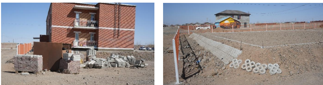
Зураг № 12 Цогтцэций сумын 10 айлын орон сууцны гадна тохижилтын ажлын явц

3.31 Хилийн цэргийн 0131 дүгээр ангийн Штабын барилгыг барих ажлыг 2024-2026 онд хэрэгжүүлж дуусахаар төлөвлөсөн ч барилгын ажлын гүйцэтгэл 38.1 хувьтай байгаа нь төлөвлөсөн хугацаанд ашиглалтад хүлээлгэн өгөхгүй байх эрсдэлийг үүсгэсэн байна.