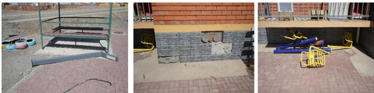
Зураг №02 Ханхонгор сумын 10 айлын орон сууцны барилгын гадна тохижилт хийгдээгүй байдал

- Өмнөговь аймгийн Ханбогд сумын "Онцгой байдлын хэлтсийн сургалтын төвийн барилгыг барьж ашиглалтад оруулах" ажлыг Энхбодиз ХХК гүйцэтгэж Улсын комиссын үүрэг даалгаврын биелэлтээр хүлээн авсан боловч ангийн халаалтын төвийн шугам сүлжээ хийгдээгүй, бохирын шугам төвийн шугамд холбогдоогүй, цутгалтын багана болон дүүргэлтийн хана хооронд хагарал үүссэн, таазны замаск хууларсан, душ, сауны өрөөнд халуун ус байхгүй, усны даралт муу, үүдний шилэн хаалга хагархай, цонхны резин байхгүй, порчигны нугас дутуу, галын дохиолол, гидрантын холболт хийгдээгүй, халаалтын буцах шугам буруу тавигдсан, зарим өрөөний паар халахгүй, ус алдсан, усны шугамын бэхэлгээ дутуу зэрэг зөрчилтэй байхад барилга байгууламжийн өрлөг, заслын ажлын стандартад техникийн хяналтыг хэрэгжүүлээгүй, комисс журмын дагуу ашиглалтад хүлээн аваагүй байна.