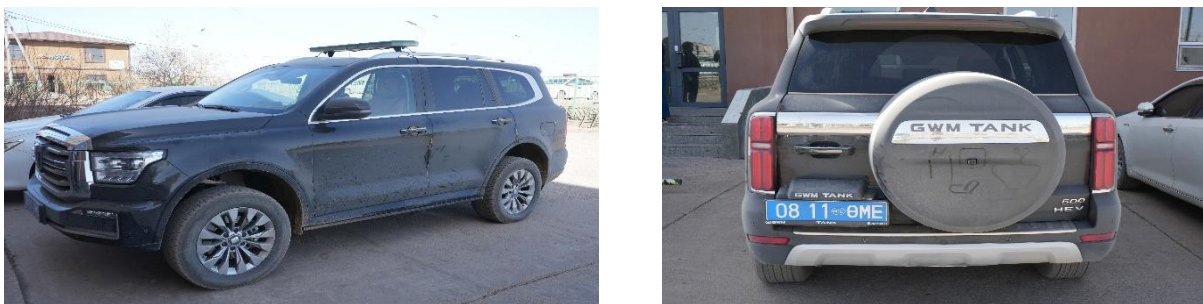
Зураг №08 Цогтцэций сумын Эрүүл мэндийн төвийн Great Wall Tank 500 маркийн автомашин

- Цогтцэций сумын "Тэгш дүүрэн тохижилт" ОНӨААТҮГ-ыг хог хаягдал тээвэрлэх машин, техник хэрэгслээр хангах ажлын хүрээнд хүлээн авсан Dongfong маркийн автомашин нь ашиглалтын явц нормоос 40-50 литр шатахуун илүү зарцуулалттай байна.