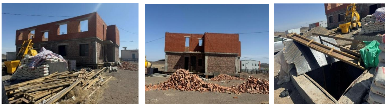
Зураг №11 Ноён сумын 10 айлын орон сууцны барилгын ажлын явц

3.29 Шинэ мянган айл хөтөлбөрийн хүрээнд Даланзадгад суманд түрээсийн орон сууцны сан бүрдүүлэх ажил гүйцэтгэж буй байгууллагын гэрээний хэрэгжилтэд захиалагч хяналт тавьж, гүйцэтгэлээр санхүүжилт олгодоггүй, хариуцлага тооцдоггүй, гэрээний хугацааг сунгаж ажил удаашруулсан зөрчил давтан гарсаар байна.