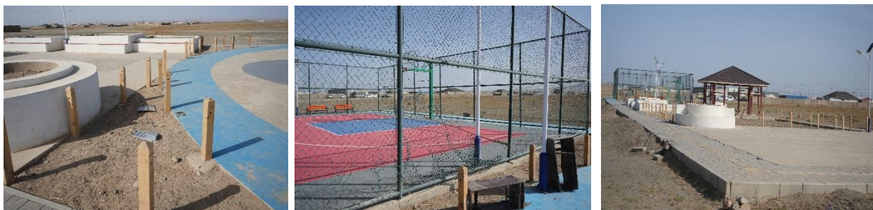
Зураг №20 Чандмань 9 дүгээр багийн чийрэгжүүлэлтийн талбай

- Зүүн сайхан 5 дугаар багийн цогцолбор тоглоомын талбайн ажлыг дуусгах, Дунд сайхны 4 дүгээр багт тоглоомын талбай байгуулах, "Чандмань 9 дүгээр багт чийрэгжүүлэлтийн талбай барих ажил"-ыг тус тус ашиглалтад оруулсан боловч сагсны шитний самбар хагарсан, хашлаганы тор урагдсан, талбайн цемент хагарсан, гэрлийн шон, явган замын гэрэлтүүлэг эвдэрч алга болсон, сандал, хогийн сав, талбайн тор болон бусад эд зүйлс эвдэрч хэмхэрсэн байдалтай байна.