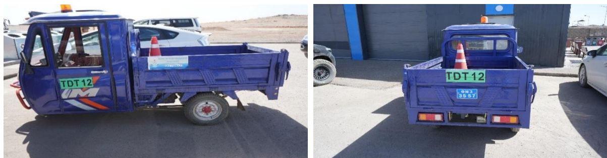
Зураг №24 Тэгш дүүрэн тохижилт" ОНӨААТҮГ-ын хог тээвэрлэх 3 дугуйт мотоцикл

- Гурвантэс сумын залуучуудын хөгжлийн төвийг барьж ашиглалтад оруулах ажлыг төсвийн 3,959.8 сая төгрөгөөр хэрэгжүүлсэн нь тус сумын залуучууд чөлөөт цагаа зөв