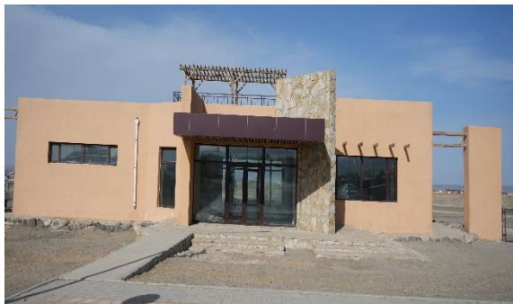
Зураг №15 Даланзадгайн цэцэрлэгт хүрээлэнгийн сургалт мэдээллийн төвийн барилга

- Даланзадгайн цэцэрлэгт хүрээлэн байгуулах-Багц-3 ажлыг төсвийн 1,075.5 сая төгрөгөөр хэрэгжүүлэхээр 2023 онд эхлүүлсэн ч захиалагчаас ажлын зургийг өөрчилсөнтэй холбоотойгоор төлөвлөсөн хугацаанд ажил хэрэгжээгүй, цөөрөм, усалгааны шугам хоолойн ажлын зураг, төсөв 2025 оны 04 сард магадлалын дүгнэлтээр баталгаажсан бөгөөд мэдээллийн төвийн барилгыг 2024 онд хүлээн авсан ч зориулалтын дагуу ашиглаагүй байна.