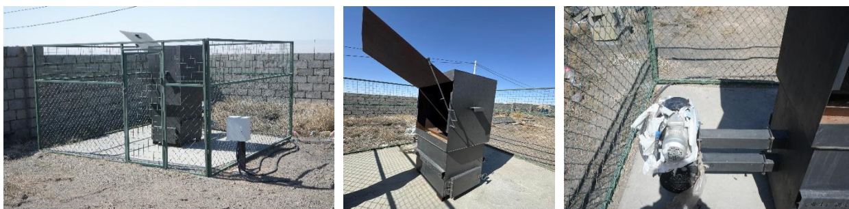
Зураг №19 Ханхонгор сум дахь хог шатаах зуух

- Ерөнхий боловсролын сургуулиудад англи хэлний кабинет байгуулах ажлын хүрээнд 90 ширхэг таблет, 90 ширхэг чихэвчийг хүлээлгэн өгсөн боловч таблет болон чихэвчний оролт таарахгүйгээс шалтгаалан 4.4 сая төгрөгийн үнийн дүнтэй чихэвч ашиглагдахгүй байна.