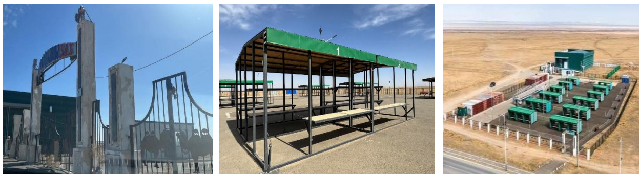
Зураг №13 "Худалдааны төв зах"-ын барилга байгууламж

Булган суманд худалдаа, үйлчилгээ, мэдээллийн төв, нийтийн ариун цэврийн байгууламж барих ажлыг орон нутгийн төсвийн хөрөнгийн 849.2 сая төгрөгөөр хэрэгжүүлэн 2025 оны 9 сард барилга байгууламжийг ашиглалтад хүлээн авсан ч зориулалтын дагуу ашиглаагүй байна.