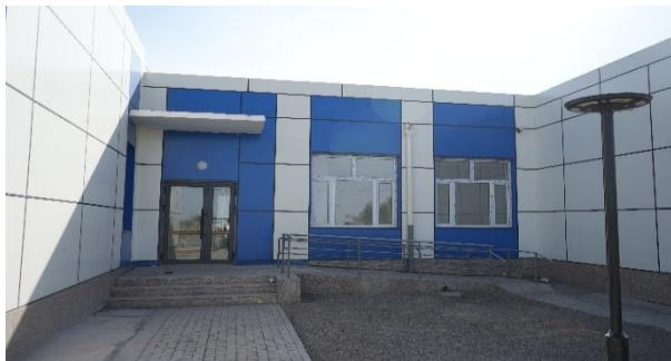
Зураг №16 Даланзадгад сум дахь Тэмээний төрөлжсөн мал эмнэлгийн барилга

- "Даланзадгад суманд тэмээний төрөлжсөн мал эмнэлгийн барилгыг барьж ашиглалтад оруулах" ажлыг төсвийн 2,571.0 сая төгрөгөөр хэрэгжүүлэн 2025 оны 10 дугаар сард ашиглалтад хүлээн авсан ч орон нутгийн өмчийн хуулийн этгээд байгуулах асуудал шийдэгдээгүйгээс одоог хүртэл ашиглалтад оруулаагүй оффисын барилга, тоног төхөөрөмжийн хамт ашиглалтгүй байна.