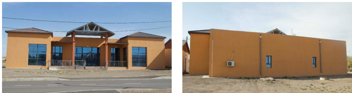
Зураг №14 Булган сумын худалдаа, үйлчилгээ, мэдээллийн төвийн барилга

Булган суманд худалдаа, үйлчилгээ, мэдээллийн төв, нийтийн ариун цэврийн байгууламж барих ажлыг орон нутгийн төсвийн хөрөнгийн 849.2 сая төгрөгөөр хэрэгжүүлэн 2025 оны 9 сард барилга байгууламжийг ашиглалтад хүлээн авсан ч зориулалтын дагуу ашиглаагүй байна.