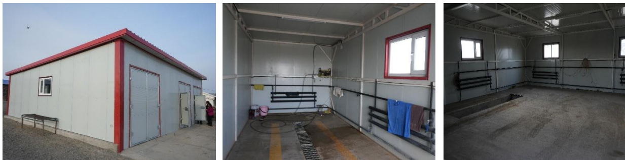
Зураг №22 Сэврэй сумын төрийн үйлчилгээний авто машины грашын барилга

Төвийн цахилгаан дулаан цэвэр усны шугамд бүрэн холбосон байна.