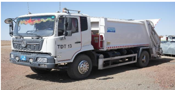
Зураг №9 "Тэгш дүүрэн тохижилт" ОНӨААТҮГ-ыг хог хаягдал тээвэрлэх машин