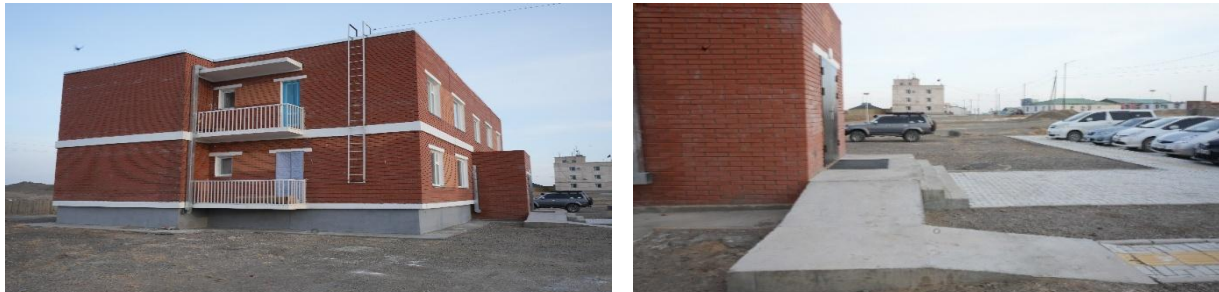
Зураг №01 Сэврэй сумын 10 айлын орон сууцны барилгын гадна тохижилт хийгдээгүй байдал

- Ханхонгор суманд 10 айлын орон сууц барьж, ашиглалтад оруулах ажлыг төсвийн 1,260.0 сая төгрөгөөр гүйцэтгэсэн Бизнес фокус ХХК гадна тохижилтын ажил, 0.4 шугамын дэд өртөө бүрэн хийгдээгүй байхад улсын комисс хүлээн авч ашиглалтад оруулсан байна.