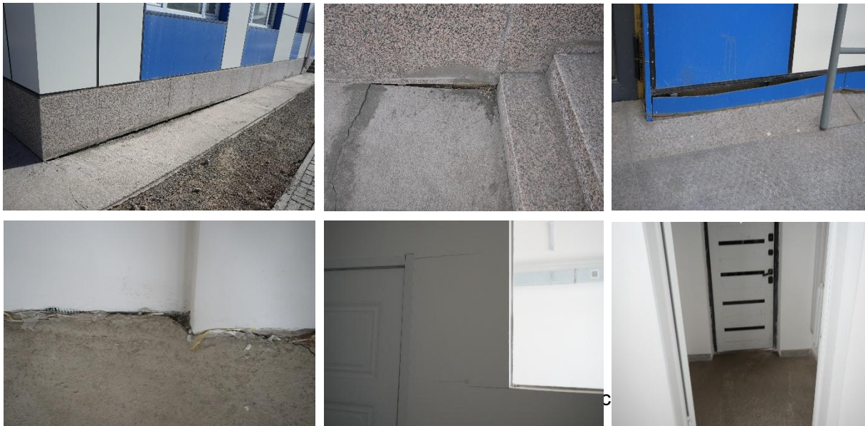
Зураг №07 Даланзадгад суман дахь Тэмээний төрөлжсөн мал эмнэлгийн барилга

- Эрүүл мэндийн төвийг туулах чадвар сайтай автомашинаар хангах, Great Wall Tank 500 маркийн автомашины хөдөлгүүрийн багтаамж зөрүүтэй, Төрийн байгууллагын хүртээмжийг нэмэгдүүлэх, шуурхай хүргэх зорилгоор төрийн байгууллагад автомашин авах Great Wall Tank 500, Цагдаагийн хэлтэст алсын болон ойрын дуудлагын тээврийн хэрэгсэл худалдан авах ажлын Great Wall Tank 500 маркийн автомашинуудыг нийлүүлэх гэрээ, техникийн тодорхойлолтод заасан 2025 онд үйлдвэрлэгдсэн байна гэсэн шаардлагыг хангаагүй байхад комиссын актаар ашиглалтад хүлээн авсан байна.