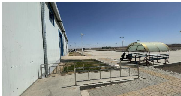
Зураг №17 Даланзадгад сум дахь Хог хаягдал дахин боловсруулах үйлдвэрийн барилга, тоног төхөөрөмж

- Хог хаягдал дахин боловсруулах үйлдвэрийн барилга барих ажлыг тоног төхөөрөмжийн хамт төлөвлөн хэрэгжүүлсэн ч уг үйлдвэр тоног төхөөрөмжийг хүчин чадал зориулалтын дагуу ашиглаагүй байна.