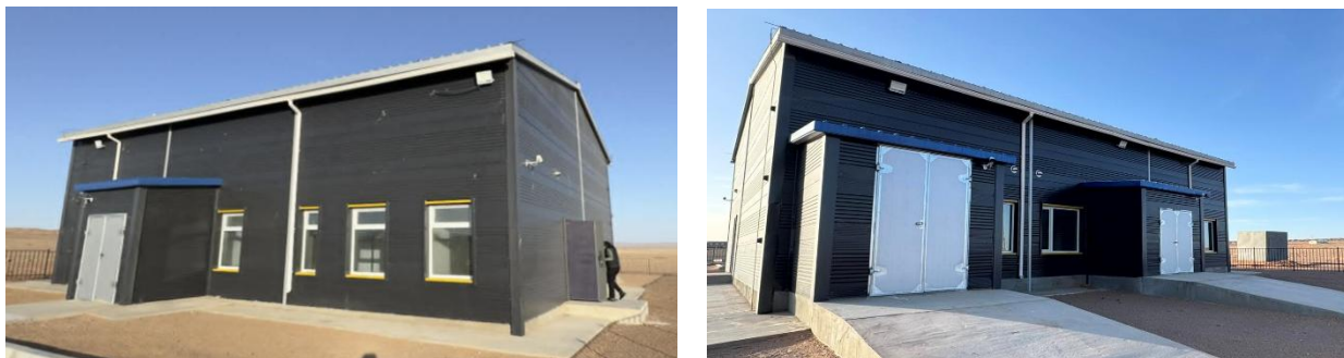
Зураг №18 Цогт-Овоо суманд барьсан мал нядалгааны газрын барилга

- Ханхонгор сум байгаль хамгаалах чиглэлийн хөрөнгө оруулалтаар "Хог шатаах зуух" барих ажлыг төсвийн 26.8 сая төгрөгөөр хэрэгжүүлсэн боловч уг хөрөнгийг зориулалтын дагуу ашиглаагүй байна.