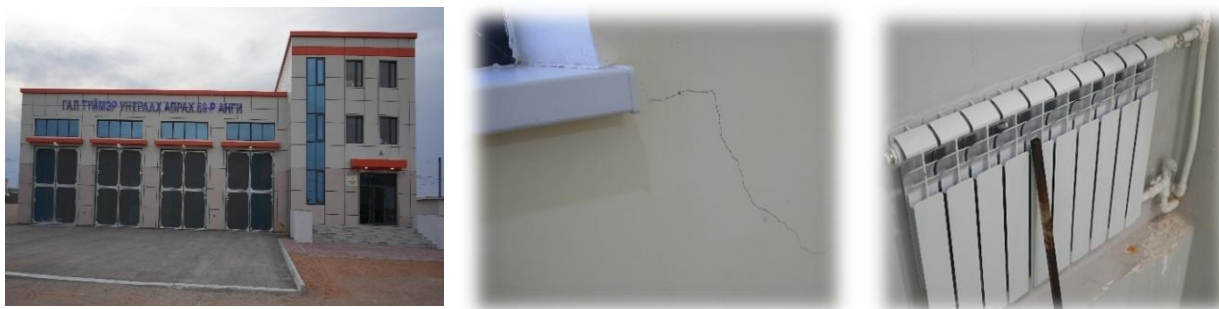
Зураг №03 Ханбогд сумын Онцгой байдлын хэлтсийн сургалтын төвийн барилга

- Өмнөговь аймгийн Ханбогд сумын "Онцгой байдлын хэлтсийн сургалтын төвийн барилгыг барьж ашиглалтад оруулах" ажлыг Энхбодиз ХХК гүйцэтгэж Улсын комиссын үүрэг даалгаврын биелэлтээр хүлээн авсан боловч ангийн халаалтын төвийн шугам сүлжээ хийгдээгүй, бохирын шугам төвийн шугамд холбогдоогүй, цутгалтын багана болон дүүргэлтийн хана хооронд хагарал үүссэн, таазны замаск хууларсан, душ, сауны өрөөнд халуун ус байхгүй, усны даралт муу, үүдний шилэн хаалга хагархай, цонхны резин байхгүй, порчигны нугас дутуу, галын дохиолол, гидрантын холболт хийгдээгүй, халаалтын буцах шугам буруу тавигдсан, зарим өрөөний паар халахгүй, ус алдсан, усны шугамын бэхэлгээ дутуу зэрэг зөрчилтэй байхад барилга байгууламжийн өрлөг, заслын ажлын стандартад техникийн хяналтыг хэрэгжүүлээгүй, комисс журмын дагуу ашиглалтад хүлээн аваагүй байна.