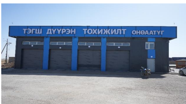
Зураг №10 "Тэгш дүүрэн тохижилт" ОНӨААТҮГ-ын барилга

- Тэгшдүүрэн тохижилт ОНӨААТҮГ-ын барилга болон тавилга, тоног төхөөрөмжөөр хангах ажлын галын дохиоллын холболт хийгдээгүй, цементэн талбайн хайрга бутарсан байна.