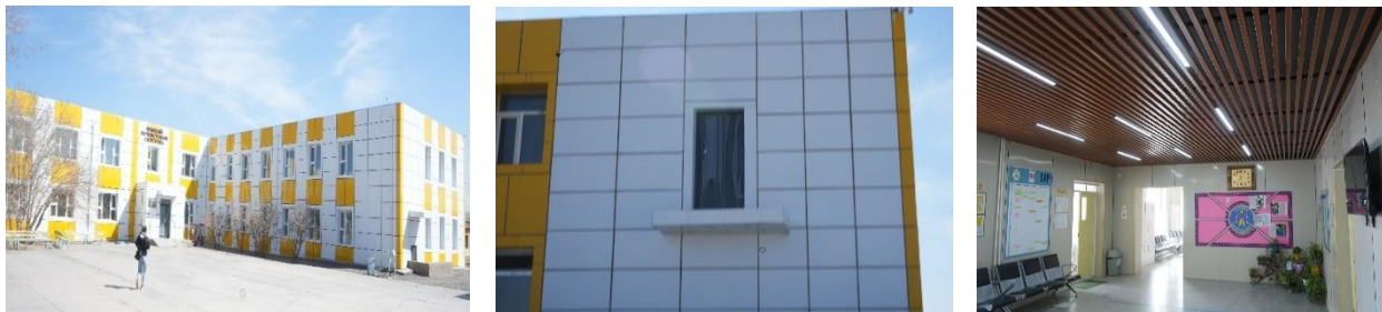
Зураг №05 Гурвантэс сумын дунд сургуулийн барилга

- Орон нутгийн 3,128.5 сая төгрөгийн төсвийн хөрөнгөөр хэрэгжүүлсэн "Ханбогд сумын Цагдаагийн хэлтсийн барилга барьж эхлүүлэх" ажлын 1 давхрын ариун цэврийн өрөөнд хөгжлийн бэрхшээлтэй иргэдэд зориулсан хэсгийг тохижуулаагүй, аваарын гарц хаалга болон шатны хэсгийн цонхыг зураг төсөвт тусгагдсанаас зөрүүтэй хийсэн байна.