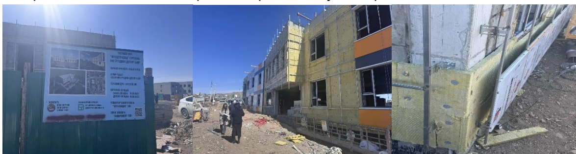
Орхон аймаг дахь Төрийн аудитын газар