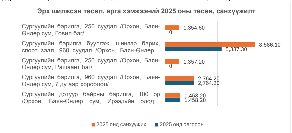
Дүрслэл №1 Эрх шилжсэн төсөл, арга хэмжээний 2025 оны төсөв, санхүүжилт

Эрх шилжээгүй 6 төсөл, арга хэмжээнээс 5 нь 2025 онд бүрэн дуусаж, 1 нь шилжин хэрэгжиж байгаа ба санхүүжилт, хөрөнгийн бүртгэлийг Боловсролын сайд болон Хот байгуулалт, барилга, орон сууцжуулалтын сайд хариуцаж байна.