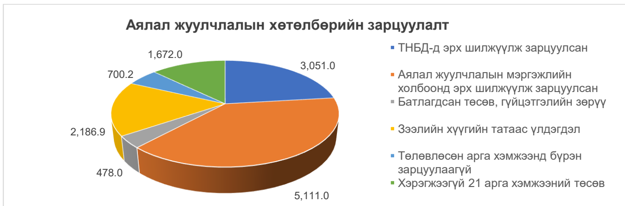
Дүрслэл 4. Аялал жуулчлалын хөтөлбөрийн зарцуулалт 2024 он /сая.төгрөгөөр/

2.4. Аялал жуулчлалын хөтөлбөрийн батлагдсан хөрөнгөнөөс төлөвлөгөөнд тусгагдаагүй ч аялал жуулчлалыг хөгжүүлэхтэй холбоотой бусад арга хэмжээнд зарцуулсан байна. Тухайлбал,