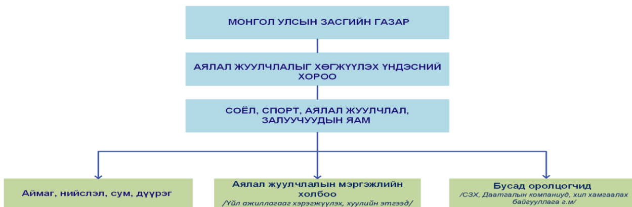
Дүрслэл 2. Монгол Улс дахь аялал жуулчлалын салбарын чиг үүрэг бүхий байгууллагуудын 2025 оны бүтэц зохион байгуулалт