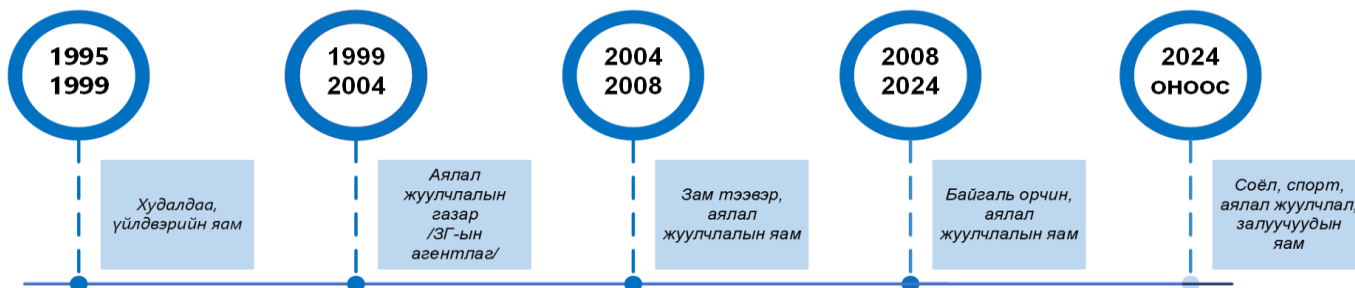
Дүрслэл 1. Монгол Улс дахь аялал жуулчлалын салбарын шилжилт, хөдөлгөөн