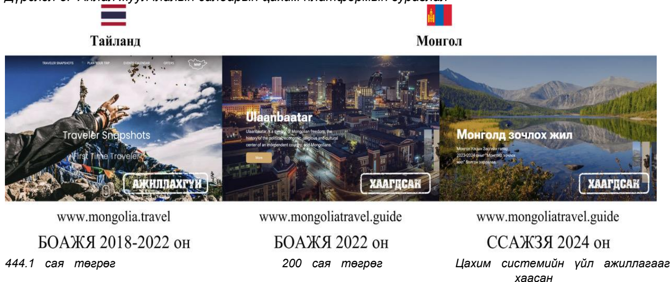
Дүрслэл 5. Аялал жуулчлалын салбарын цахим платформын зураглал