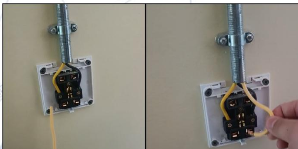
Зураг 1. Хужирт сумын 1, 2 дугаар сургуулийн дотуур байрны засварын ажлын даалгаварт байх газардуулгын утас холбоогүй

Зарим үүрэг даалгаврын биелэлтийг газар дээр нь очиж шалгах үед хийсэн ажил байхгүй байна.