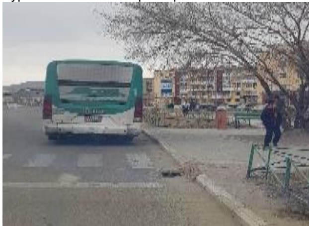
Зураг 1. Нийтийн тээврийн үйлчилгээний зогсоол

чиглэлийн 26 зогсоолоос 8 зогсоол MNS 5879:2012 стандартын 4.4 17 , 4.7 18 , 6.3 19 , 7.6 20 -д заасан шаардлагыг хангахгүй байна.